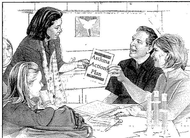
Share your Asthma Action Plan with others.